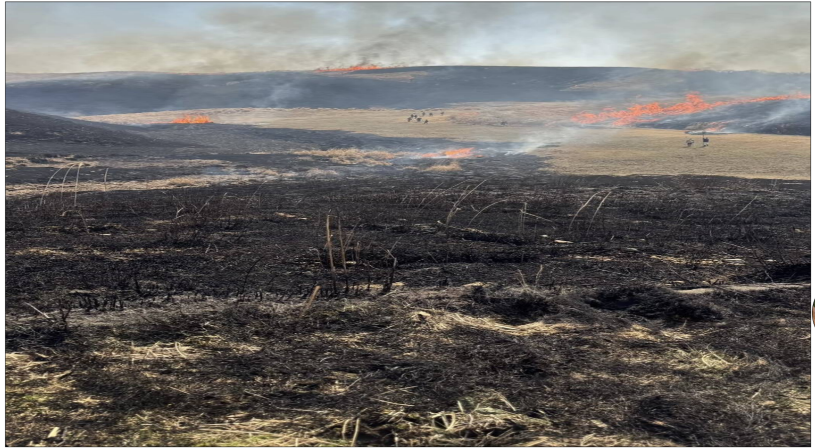
阿蘇の野焼き 2026年3月8日撮影